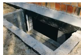
цокольные и подвальные ниши