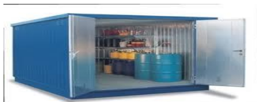
склады лакокрасочных, горючесмазочных, легковоспламеняющихся и взрывоопасных материалов.