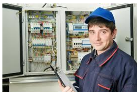
распределительные телефонные и электрощиты