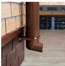
водосливные решетки и трубы